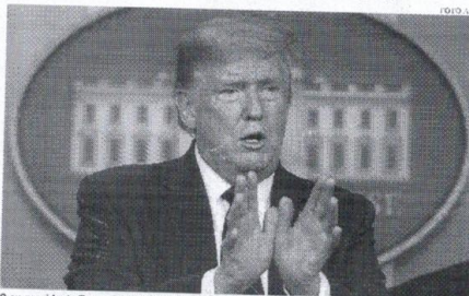
O ex-presidente Trump foi absolvido pela segunda vez em um processo de impeachment

O presidente dos Estados Unidos, Joe Biden, declarou que a absolvição de Donald Trump no processo de impeachment aberto depois que ele incluiu uma insurreição em seu lema sobre a fragilidade da democracia. "Este triste capítulo de nossa história nos lembrou que a democracia é frágil. Que deve ser sempre defendida. Que devemos estar sempre alertas. Que a violência e o caos não têm lugar na América", disse Biden, horas depois da votação no Senado americano que não chegou a maioria qualificada de dois terços do plenário para declarar o ex-presidente culpado.